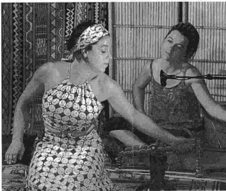
Zélie les histoires. Ce spectacle de la compagnie sensibilise le public à la pénurie d'eau en Afrique

Interactif. Demain, le second opus de la troupe promène les spectateurs sur les rives du fleuve Niger. Lucie Malbosc et Clémentine Malloin sensibilisent ainsi le public à la pénurie d'eau en Afrique avec « Zélie les histoires », un spectacle articulé autour des pérégrinations d'une enfant.