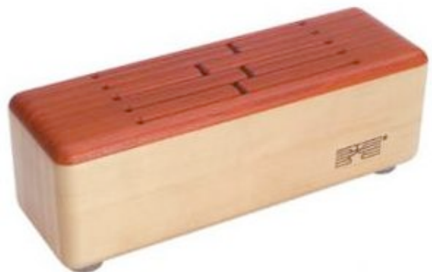
Tamboa, percussions. Inspiré de la famille des tambours à fentes d'origines diverses (Afrique, Océanie, Amérique du Sud...)