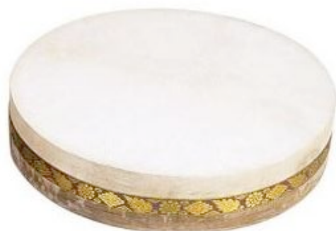
Oceandrum, percussions. Inde