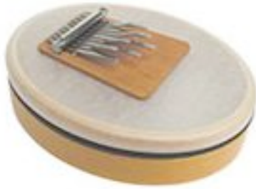
Sanzula, percussions. Origines africaines