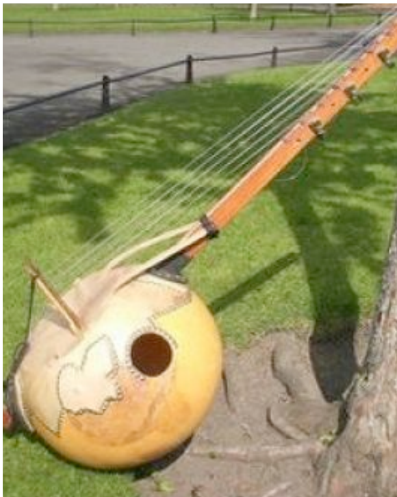
Goni, instruments à cordes. Mali