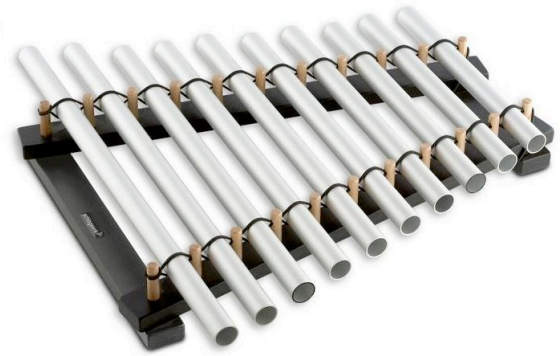
Table Tube, percussions.