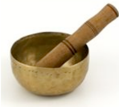
Bol chantant. Tibet